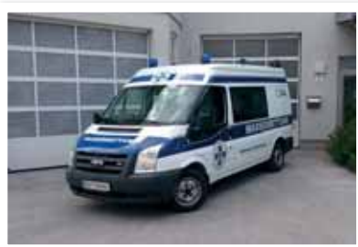
Hat keinen Platz mehr in der Garage: das Einsatzfahrzeug der Wasserrettung.

Hat man in den letzten Jahren durch viel Improvisation die prekäre Platzsituation noch mehr schlecht als recht »überspielen« können, so ist nun ein Zustand erreicht, der eine räumliche Erweiterung zur Aufrechterhaltung der Einsatzfähigkeit unbedingt nötig macht.