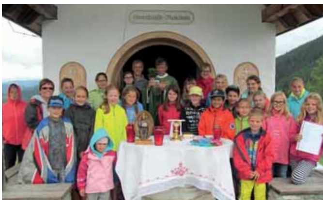
Hl. Messe bei der Hirtenkapelle.