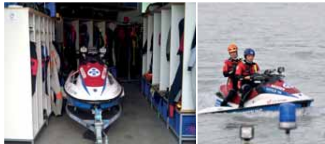
Der Jetski muss erst aus der Garage gezogen werden, bevor sich die Mannschaft umziehen kann.

Da sich das Betreuungsgebiet der Wasserrettung über 13