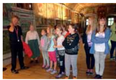
Im Rittersaal von Schloss Goldegg.

Beim lustigen Spieleabend in unserem Turm war dann die Müdigkeit bereits schnell vergessen und die Zeit ver-