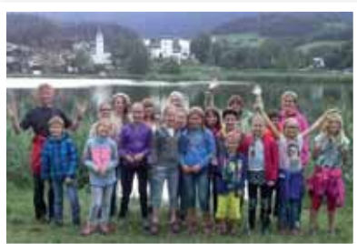
Gruppenfoto vor dem See.

schlafen – ich unten usw. – aber Marlene hatte die Mädels gut unter Kontrolle und es gab dann keine weiteren Diskussionen.