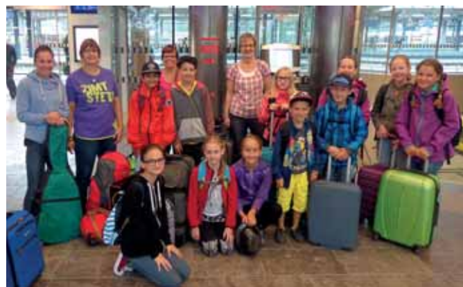
Anfang und Ende einer Reise im Bahnhof Wörgl.

Die Ministranten von Kramsach haben drei tolle Tage im Land Salzburg erlebt und haben den Grundstein einer „Mini-Gemeinschaft Kramsach“ gelegt.