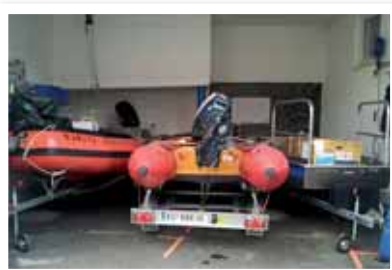
Beengt geht es zu in der Fahrzeuggarage.

Führt man sich vor Augen, dass die Wasserrettung Mittleres Unterinntal ein Gebiet von 13 Gemeinden zu betreuen hat, erklärt sich der notwendige Stand an