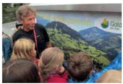
Führung durch Goldegg.