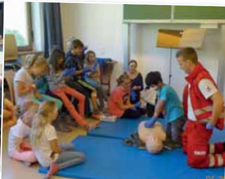
Die Schüler und Schülerinnen der vierten Klassen übten die richtigen Handgriffe im Notfall.

„Mama, stell dir vor, heute war der Klimaclown da und hat ein paar Kinder sogar auf die Schultern genommen. Er hat mit uns besprochen, wie wir alle das Klima auf der Erde verbessern können.“ Diese Aussage ihrer Kinder hörten einige Mütter am 2. April.