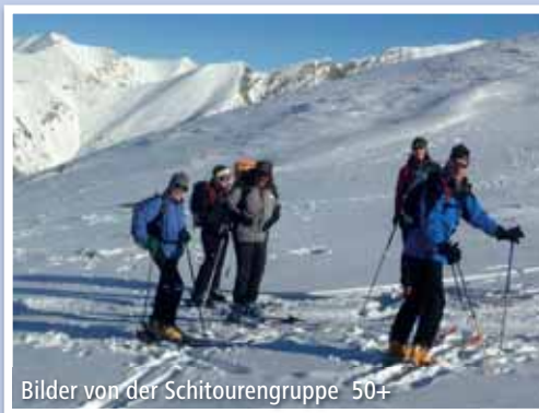
Bilder von der Schitourengruppe 50+