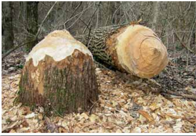
Der Biber als Holzfäller.

Biber sind sehr gesellige Tiere und pflegen ein reges Familienleben. Die Elterntiere bleiben ein Leben lang zusammen und können bis zu 15 Jahre alt werden. Im Mai/Juni werden, nach einer Tragezeit von 105 Tagen, in der Regel ein bis drei Biberbabys geboren. Das bedeutet, dass die zweijährigen Biber die Familienidylle verlassen müssen, um sich ein eigenes Revier zu erschließen. Dadurch kommt es zu keiner Übernutzung des Lebensraumes, und der Biberbestand in einem bereits bestehenden Revier bleibt konstant.