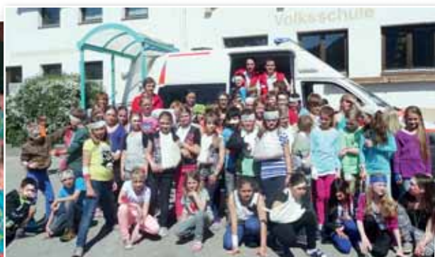
Am Erste-Hilfe-Projekttag in der Volksschule gab es jede Menge „Verletzte“ zu versorgen.