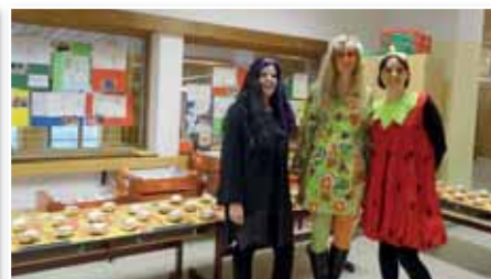
Frische Krapfen warteten im Fasching auf die hungrigen Volksschulkinder.

Am 25. April fand für die Schüler der vierten Klasse der Erste-Hilfe-Projekttag in Zusammenarbeit mit dem Roten Kreuz statt. Der ganze Vormittag stand im Zeichen der schnellen Hilfe im Notfall. Die Kinder durften Notrufe tätigen, Erste Hilfe leisten, ein Rettungsauto in Beschlag nehmen, Fragen stellen und besonders beliebt ist seit Jahren die Verbandsstation, wo die „wildesten“ Verletzungen der Kinder mit professionellen Verbänden versorgt werden.