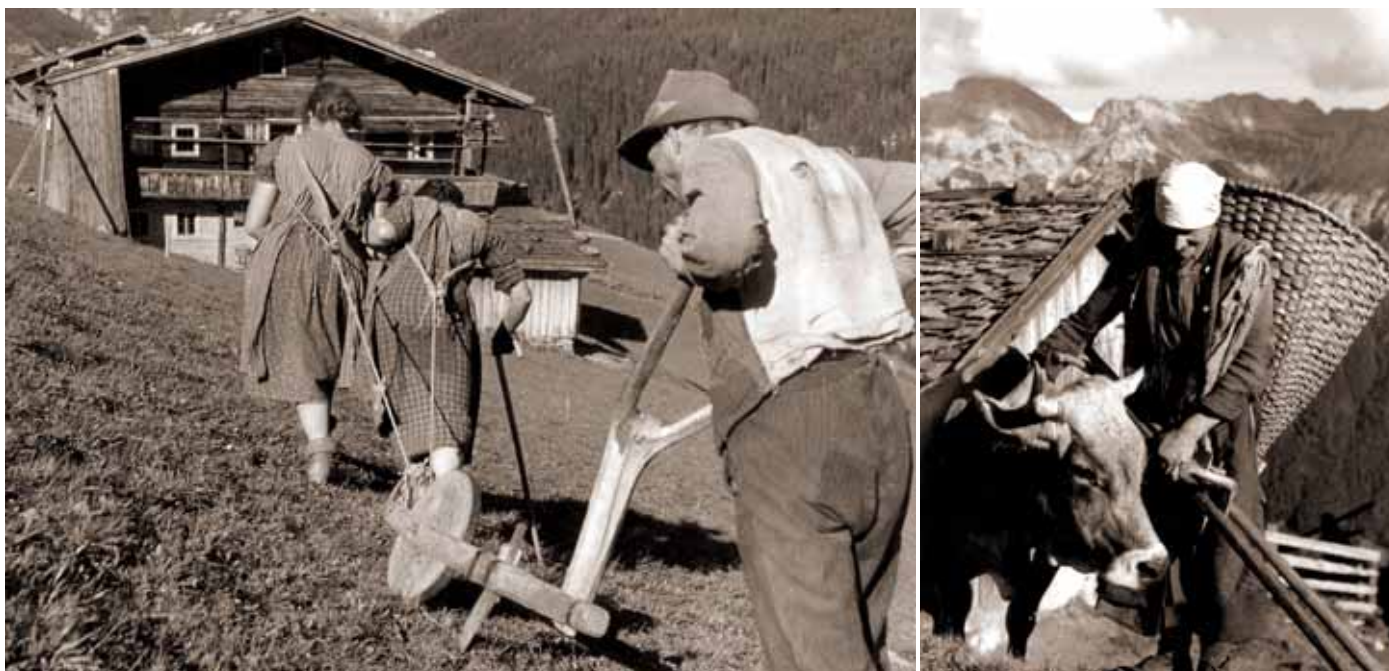
Links: Vorpflügen im Tuxertal, 1943. Rechts: Sennerin auf der Kaserstattalm, Stubai 1951

Die Fotoausstellung „Bauernwerk in den Bergen“ von Erika Hubatschek dokumentiert eindrucksvoll das damalige Leben der Bergbauern in den Alpen. Die Schau ist von 1. Mai bis 17. August im Museum Tiroler Bauernhöfe zu sehen.