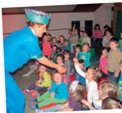
Der Kleine Prinz zu Besuch im Kindergarten.