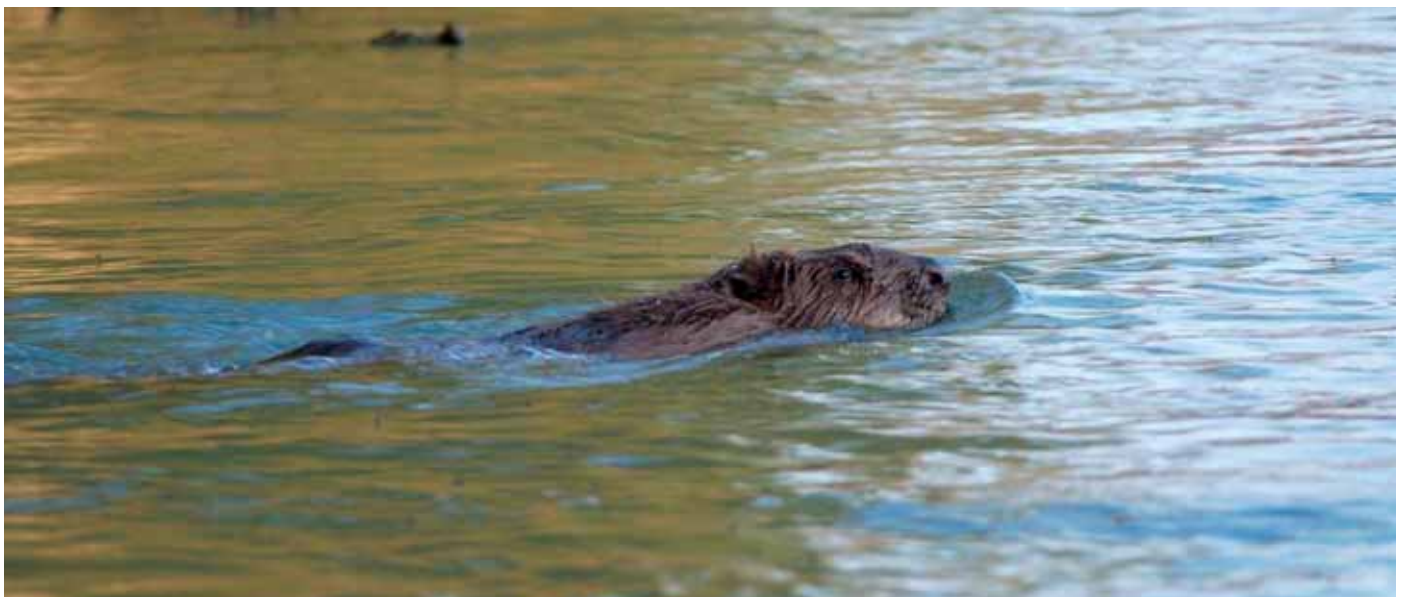
Links: Ein junger Biber. Mitte: Ein Biberbau. Rechts: Ein Biberdamm. (Alle Fotos: Wilfried Nairz und Ulrike Gander. Text: Wilfried Nairz)