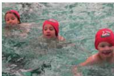
Im Schwimmkurs konnten die Kindergartenkinder ihre Schwimmfähigkeiten erweitern.

Im Fasching konnten die Kindergarten- und Volksschulkinder die vom Elternverein gesponserten Faschingskrapfen genießen. Diese kulinarischen Köstlichkeiten der Bäckerei Angerer werden schon seit einigen Jahren bei den Faschingsfeiern in den Institutionen als Jause von den Kindern sehr gerne verspeist.