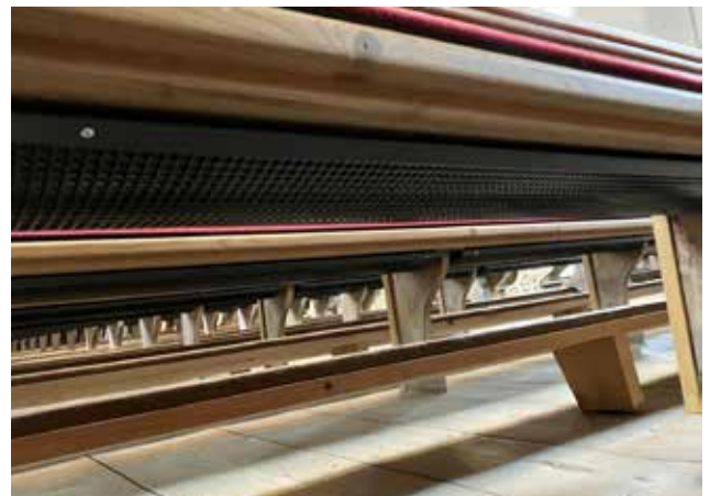
Infrarot-Strahler unter den Kirchenbänken