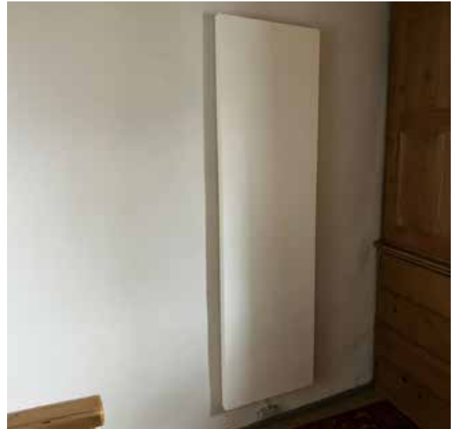
Infrarot-Panel in der Sakristei

Einige Feineinstellungen werden noch nötig sein, doch man kann zuversichtlich sein, dass sich die neue Anlage bewähren wird. Dass sich Besucherinnen und Besucher in unserer Kirche wohlfühlen, ist das erklärte Ziel. Jeder soll sich in warmer, behaglicher Atmosphäre in der Pfarrkirche Voldöpp willkommen heißen.