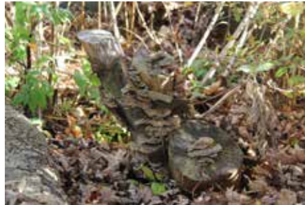
Holunder mit Judasohr

Rotkehlchen für den Bau ihrer Nester. Wer es etwas grüner und bunter haben möchte, pflanzt noch eine Clematis oder ein Geißblatt, die über die Benjes-Hecke ranken können. Zusätzlich ist eine Benjes-Hecke ein toller Sichtschutz und hält auch den Wind ab!