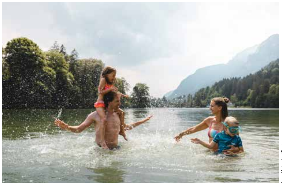
Mit bis zu 25 Grad Wassertemperatur ist der Reintalersee einer der wärmsten Badeseen Tirols.

ril 2023 gelten die vergünstigten Saisonkartentarife für den Erhaltungsbeitrag und die Parkge-