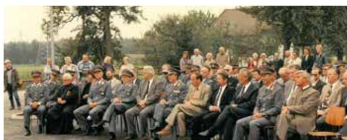
Die Ehrengäste und Behördenvertreter