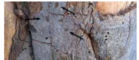
Fraßgänge von Käferlarven im Holz