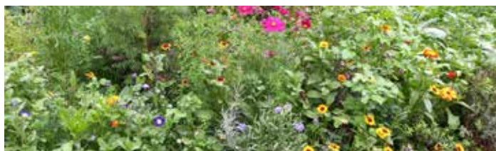
Blumenbeet mit vorgezogenen Pflanzen

Das Insektensterben ist dramatisch! Gründe: Flächenversiegelung, Pestizideinsatz und nächtliche Beleuchtung.