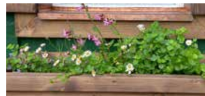
Blumenkisterl mit Gänseblümchen, Roter Lichtnelke und Gundelrebe