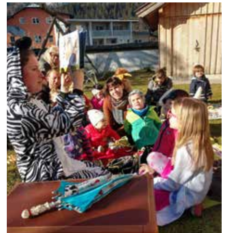
Bei warmen Wetter findet das „EKiZ Café mit der Bücherei“ im EKiZ Garten statt – heuer sogar im Fasching!