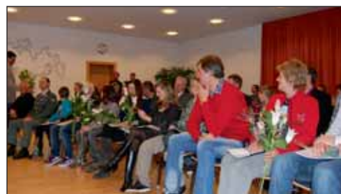
Blumen für die Damen: Die geehrten Sportlerinnen wurden nach alter Tradition mit einem Blumenstrauß bedacht.