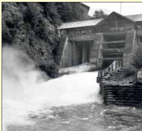
Die Erzherzog-Johann-Klause um 1950.

nisanlagen, das Altersheim, das Blaulichtzentrum und viele Wohngebäude. Text & Fotos: Norbert Wolf