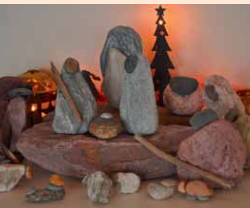
Unsere Krippe aus Steinen.