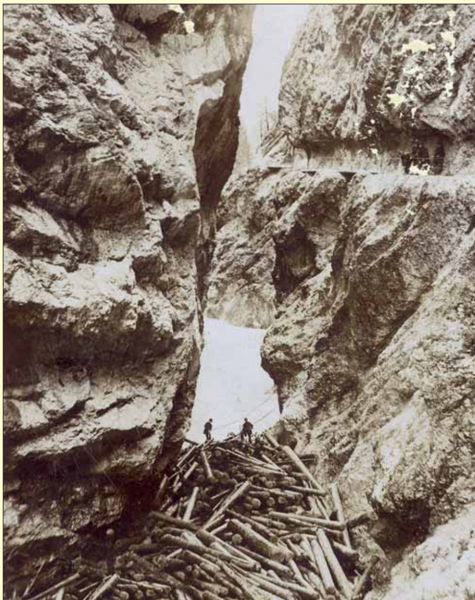
Eine Verklausung (ein »Fuchs«) in der Tiefenbachklamm um 1910.