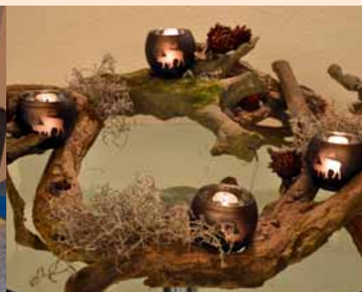
Unser Adventkranz aus Wurzeln.