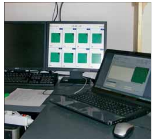
Trefferanzeige in Echtzeit auf dem Monitor.

Weitere Infos zu unserem Verein und eine detaillierte Vereinschronik finden Sie im Internet auf unserer Homepage www.sgkramsach.net .