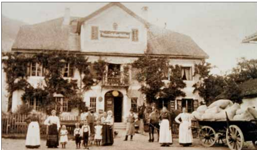
Der über 200 Jahre alte Stammsitz der Familie Duftner im Kramsacher Zentrum in einer Aufnahme um das Jahr 1905.

Einer der ältesten, heute noch bestehenden Betriebe Kramsachs feiert heuer ein rundes Jubiläum – es war eine Frau, die vor 150 Jahren den Grundstein legte.