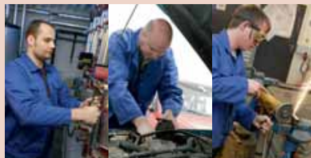
Installateur, Mechaniker, Schlosser u. v. a. gehören zu den betroffenen Berufsgruppen.

Vielen Menschen ist nicht bewusst, dass sie betroffen sind. Österreichweit sind Beratungsstellen eingerichtet worden, die Sie kostenlos informieren. Auch kostenlose Nachsorgeuntersuchungen von Lunge und Atemwegen