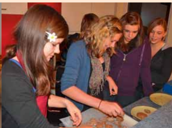
Beim Lebkuchen backen.