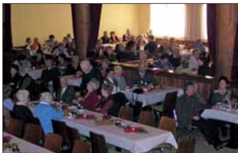
In geselliger Runde konnte man den besinnlichen Liedern der Anklöpfler lauschen und sich auf die stille Zeit einstellen.

Für die musikalische Gestaltung der Feier sorgte wieder die Anklöpflergruppe des Männergesangsverein und eine Abordnung der BMK Mariatal .