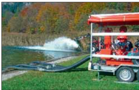
Die drei neuen, nach dem Hochwasser 2005 angeschafften Hochleistungspumpen können bis zu 2150 Kubikmeter Wasser pro Stunde abpumpen.

Alljährlich am 3. Wochenende im Oktober stellt die Feuerwehr im Rahmen einer großen Schauübung ihre Schlagkraft unter Beweis. Übungsannahme in diesem Jahr war ein Brand beim Neudegger-Bauern .