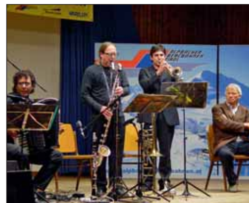
Für Raffiniert-Musikalisches mit schrägen Akzenten sorgte das Ensemble Whyrauch.

D er Lionsclub Kramsach/Seenland könnte einem Profiveranstalter schon beinahe das Fürchten lehren: Mit einer weiteren Bilderbuchveranstaltung sorgten die Lions in einem ausverkauften Volksspielhaus für einen rundum perfekten Veranstaltungsablauf. Zuschauer aus ganz Tirol und auch aus dem bayrischen Raum erlebten einen Polt in Hochform, der in seinen Sketchen die »rustikalen« Einsichten und Wahrheiten des Alltagsmenschen verarbeitet. Der Erlös kommt wie bei allen Lions-Veranstaltungen karitativen Zwecken zugute. ■