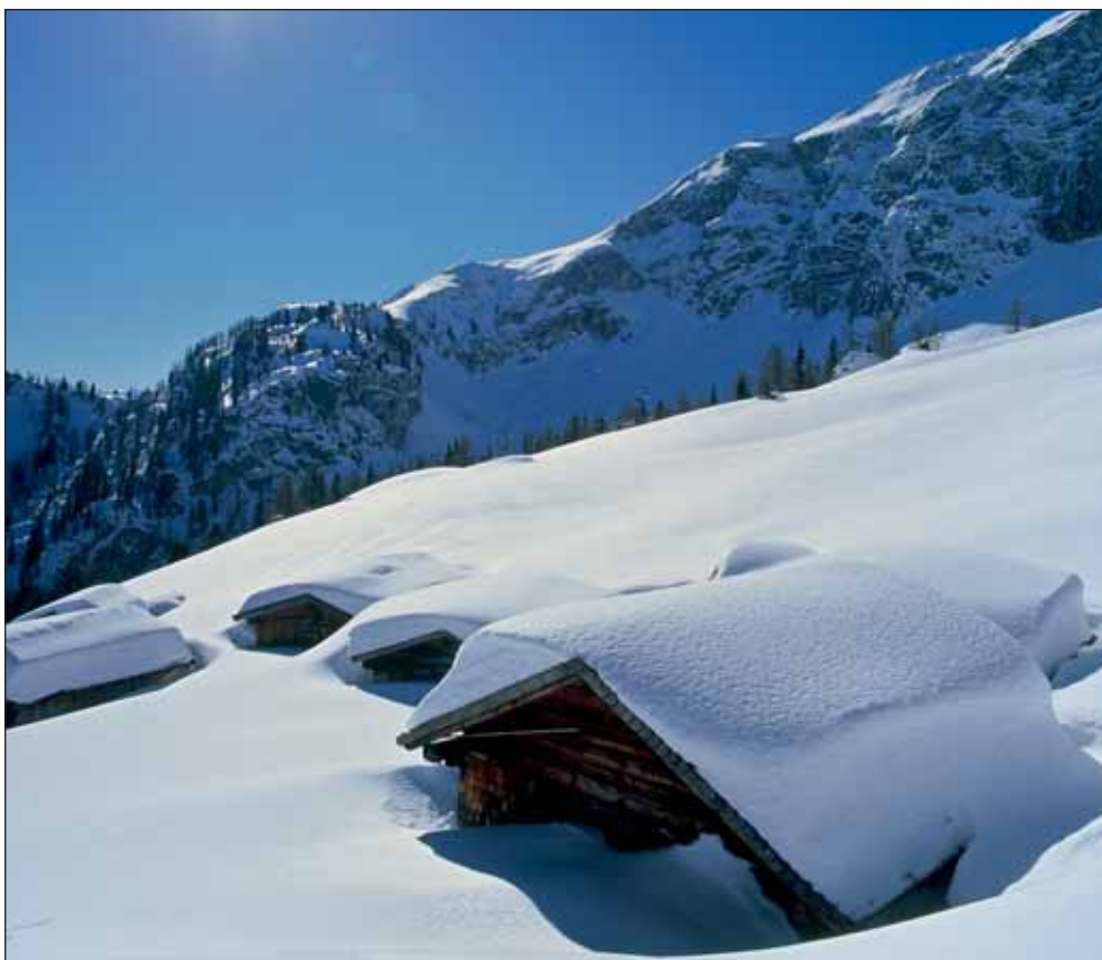
Winterstimmung: Die Zireiner Alm mit Blick auf das Rofangebirge.