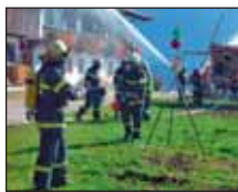
An der Atemschutzsammelstelle werden einsatztaktische Maßnahmen getroffen.

Im Vorfeld der Jahreshauptübung wurden am Seeufer die mobilen Hochleistungspumpen der Gemeinde vorgestellt, die bei Hochwasser eingesetzt werden und im Vorjahr auf Grund der Überschwemmungen im Jahr 2005 angekauft wurden. Diese haben den Vorteil, dass sie auf Anhänger montiert sind und innerhalb kürzester Zeit an jedem beliebigen Punkt im Ortsgebiet zum Einsatz gebracht werden können. ■