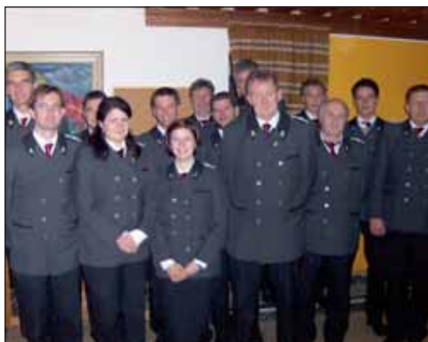
Der Ausschuss der Bundesmusikkapelle Mariatal.

Z um Abschluss des Vereinsjahres 2008 gestaltete die Bundesmusikkapelle Mariatal Ende November wieder ihr traditionelles Cäcilienkonzert in der Wallfahrtskirche Mariatal.