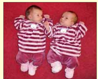
Kindersegen kam im Doppelpack: die Zwillinge der Fam. Mayr