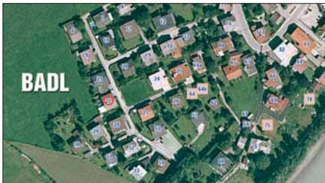
Die Lage des Objekts (Nr. 22) nahe dem »scharfen Eck«.

Alle Interessenten werden gebeten, bis spätestens 22. Jänner 2009, 16.00 Uhr, ihr Angebot schriftlich, in einem Kuvert verschlossen mit der Aufschrift »Angebot Liegenschafts Kauf Badl 22«, im Gemeindeamt Kramsach (Amtsleitung) abzugeben. ■