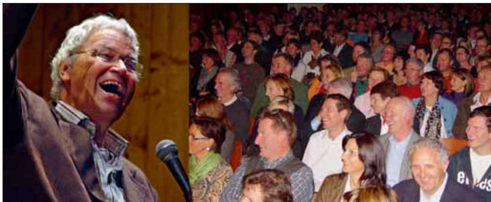
Mit bayrischem Dialekt und untrüglichem Gefühl für Tempo, Pointe und Pause trug der Künstler brachialen Stammtischhumor mit allen Zynismen des zeitgeistigen Spießertums vor und begeisterte ein ausverkauftes Volksspielhaus.

D er Lionsclub Kramsach/Seenland könnte einem Profiveranstalter schon beinahe das Fürchten lehren: Mit einer weiteren Bilderbuchveranstaltung sorgten die Lions in einem ausverkauften Volksspielhaus für einen rundum perfekten Veranstaltungsablauf. Zuschauer aus ganz Tirol und auch aus dem bayrischen Raum erlebten einen Polt in Hochform, der in seinen Sketchen die »rustikalen« Einsichten und Wahrheiten des Alltagsmenschen verarbeitet. Der Erlös kommt wie bei allen Lions-Veranstaltungen karitativen Zwecken zugute. ■