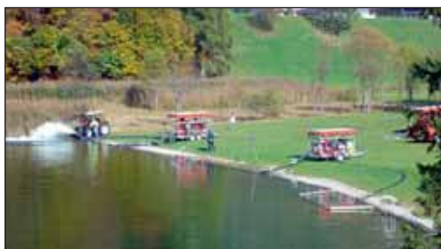
Vom Reintalersee musste eine lange Löschleitung zum Neudegger-Bauern gelegt werden.

Alljährlich am 3. Wochenende im Oktober stellt die Feuerwehr im Rahmen einer großen Schauübung ihre Schlagkraft unter Beweis. Übungsannahme in diesem Jahr war ein Brand beim Neudegger-Bauern .