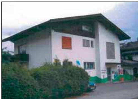
Die Nordansicht des Wohnhauses.

Die Gemeinde verkauft das ehemalige Kinderhaus »Piepmatz« im Ortsteil Badl