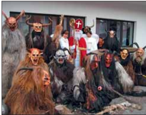
Die »Kramsacher Bergtoifi« mit dem Nikolaus vor dem Gemeindeamt: »Wir beleben altes Brauchtum wieder«, meint der »Bergtoifi«-Obmann.