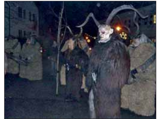
Perchtn waren ursprünglich weibliche Schreckgestalten, deren Name sich vermutlich von der Saggengestalt der »Perchta« ableitet.

Viele Merkmale des Perchten-Springens und überhaupt der Adventszeit tragen Merkmale von Fruchtbarkeitsfesten der vorchristlichen Zeit .