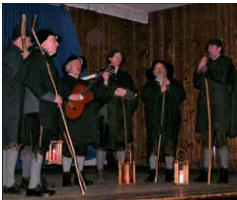
Die Anklöpfler trugen in ihren schönen Liedern die christliche Botschaft der Nächstenliebe vor.

A m Sonntag, den 30. November, lud die Gemeinde Kramsach auch heuer wieder ihre Pensionisten zur Weihnachtsfeier ins Volksspielhaus ein.