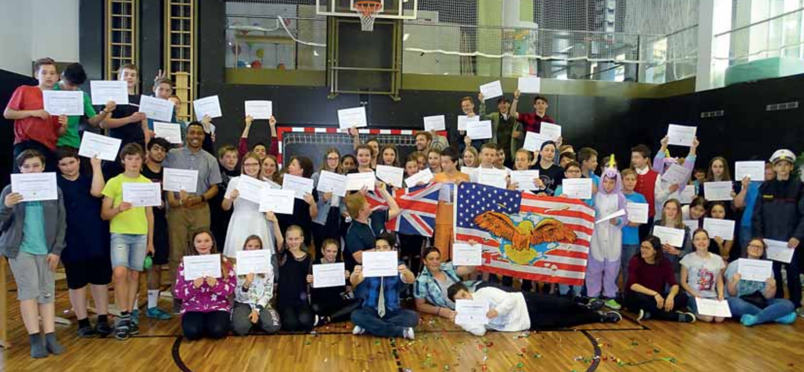
Die 3. Klassen mit ihren Native Speakern.

anderen Klassen. Jeder Schüler bekam eine eigene Urkunde mit einer originellen Diplom-Musik im Hintergrund.