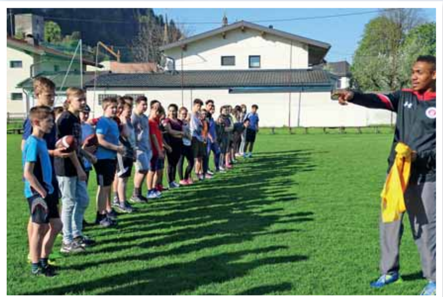
Lehrstunde in American Football

On Friday we performed the presentations in front of the parents and the second classes. After that we had ice