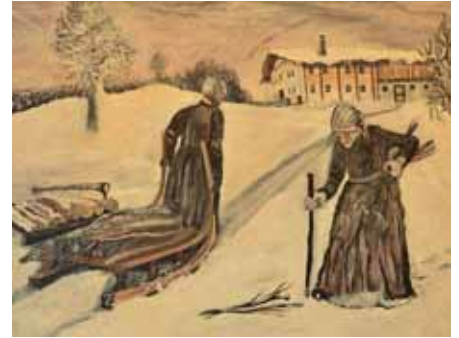
Gemalenes Bild »Hoizarbeit beim Krapfbauern«, um 1920