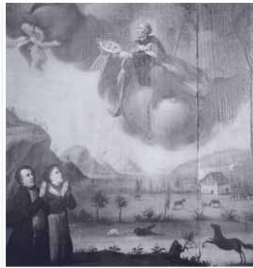
1817 wurde diese Votivtafel für die Weidachkapelle gestiftet. Dargestellt der hl. Leonhard mit einem betenden Stifterpaar

Erst im Vorjahr konnte man noch im Dachgeschoß der Kapelle eine Weihnachtskrippe und ein Ostergrab auf-finden. Verschwunden ist auch eine gotische Johannes-schüssel aus dem Jahre 1498. Sie wurde um 1900 ins Aus-