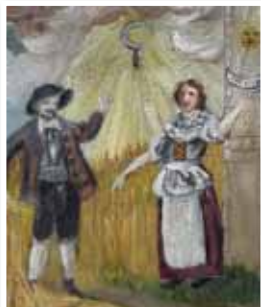
Die Heilige Notburga am Notburgahaus in Rattenberg

In Voldöpp halten wir Vesper immer am ersten Dienstag im Monat. (Sommerzeit um 19 Uhr, Winterzeit um 18 Uhr). Jede/r ist dazu herzlich eingeladen!