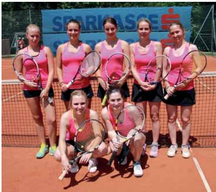
Die 1. Damenmannschaft des TC Sparkasse Kramsach auf Erfolgskurs.