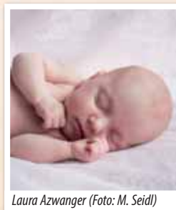
Laura Azwanger