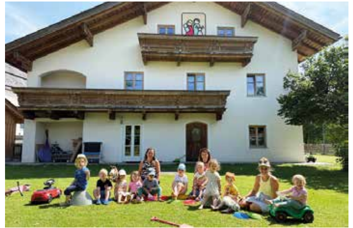
Die Krippenkinder und ihre Betreuerinnen freuen sich auf die Neuheiten und die schöne Umgebung.

Save the Date: das traditionelle Martinsfest findet am 15. November ab 16:00 Uhr statt - ein stimmungsvolles Fest mit Laternen und Punsch für Groß und Klein. Für den Verein Barbara Lechner