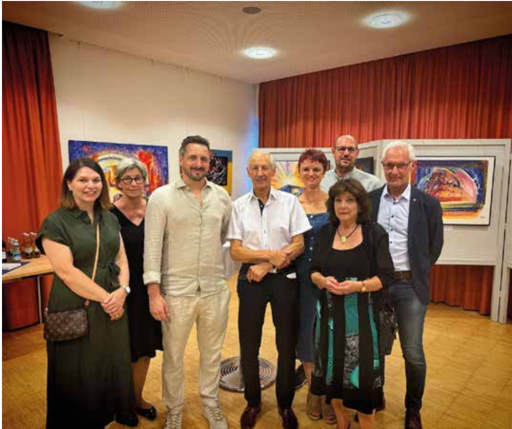
Eröffnungsfeier mit dem Künstler Werner Soboll

Die Ausstellung „Meine Welt in Bildern“ von Werner Soboll im Gemeindeamt Kramsach bot vom 6. bis 11. Juli eine besondere Gelegenheit, sich mit der vielfältigen Kunst des Künstlers vertraut zu machen. Zahlreiche Besucher, Kunstliebhaber und Neugierige kamen zusammen, um die beeindruckende Vielfalt an Bildern zu bestaunen, die Werner Soboll mit unterschiedlichen Techniken geschaffen hat. Die offizielle Eröffnungsfeier fand am 5. Juli statt und zog über 100 Kunstliebhaber an.